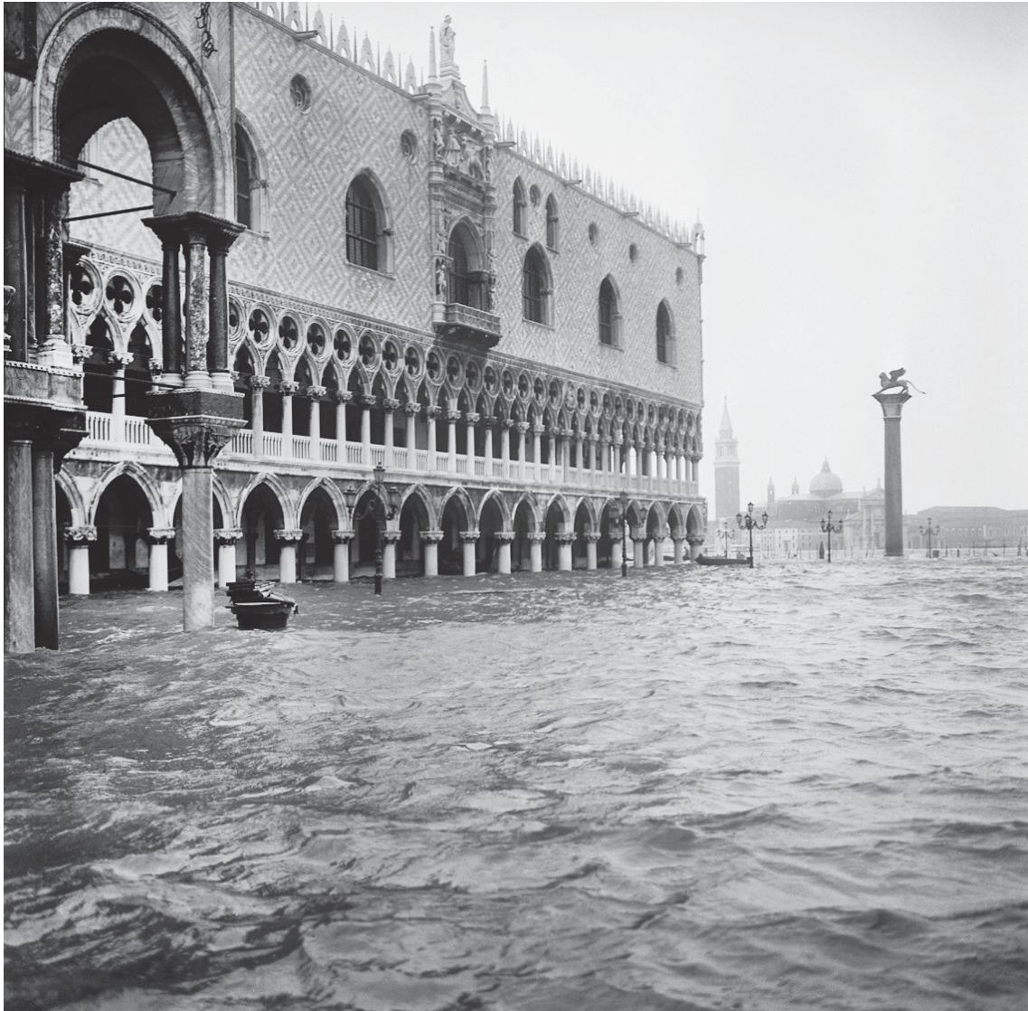
1 Der überschwemmte Markus-Platz während des Hochwassers 1966

am intensivsten empfunden wird – als Irritation und Beruhigung gleichermaßen.